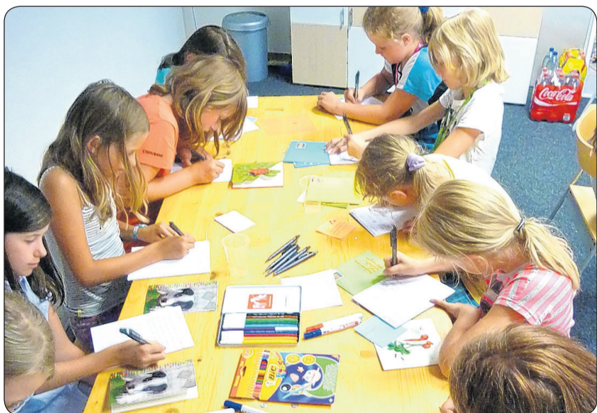
Impression aus einem Ferienpass «Coole Karten schreiben».