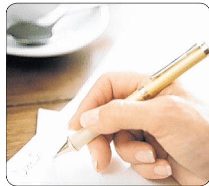
Wann haben Sie zum letzten Mal ein paar persönliche Zeilen geschrieben?

«Schreiben ist leicht. Man muss nur die falschen Wörter weglassen.» Mark Twain.