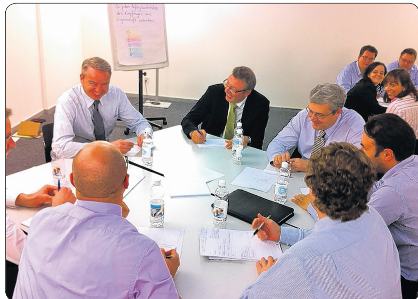
Freude am Texten bei einem Firmenseminar.