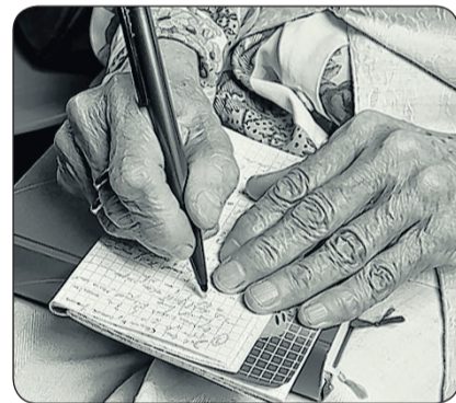
Auch im Alter wird noch einiges notiert...