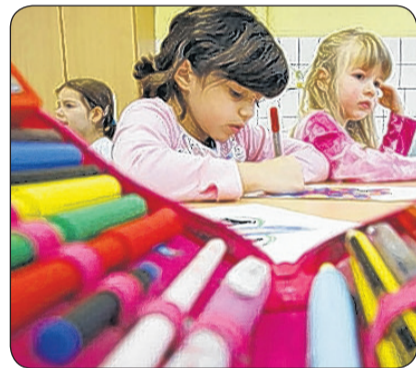
Früh übt sich, wer eine Meisterin werden will...

«Willkommen sind bei uns alle, die mit ihrer Sprache mehr erreichen wollen», erläutert Marbot. Denn für ihn ist klar, wer schreibt, hat mehr vom Leben. Und Schrei-